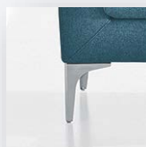
GAMBA IN METALLO CROMATO (BS 173)