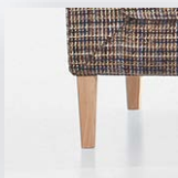
GAMBA IN LEGNO DI ROVERE VERNICIATO TINTA NATURALE (BS 172)