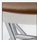
BORDO IN FINTA PELLE BIANCA