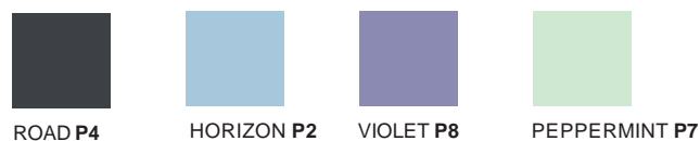
ROAD P4 HORIZON P2 VIOLET P8 PEPPERMINT P7